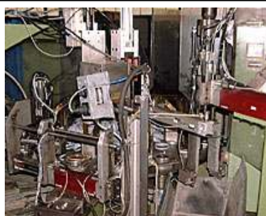
Vollautomatischer Montage-Rundtisch für Lastrollen bis 50Kg Traglast.