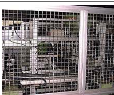
Vollautomatische Montageeinrichtung für Schwerlast Rollen 300Kg Traglast (Abb. 1)